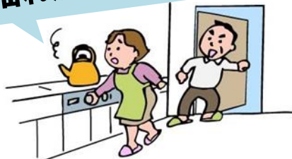
火の始末と出口確保