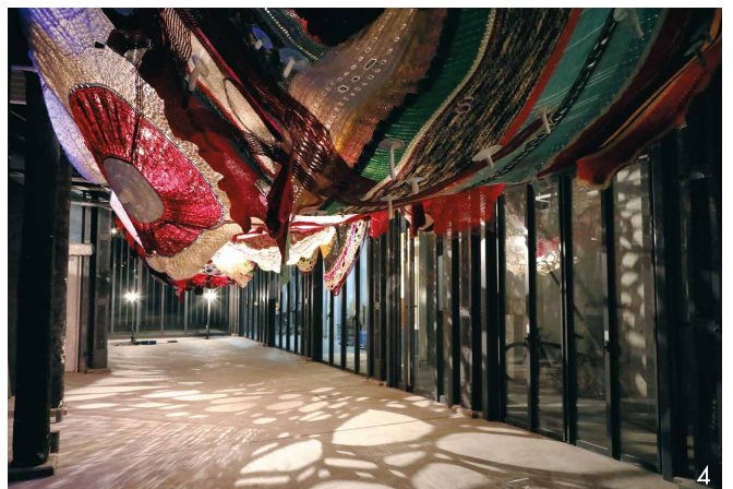
1.熊野 海 《Ghost Dance》2017 2.藤倉 麻子 《群生地放送》2018 3.金沢 寿美 《新聞紙のドロワーイング、日常の紙のドロワーイング》2017 4.二ノ宮 久里那 《変移》TOKYO CANAL LINKS #3 2018