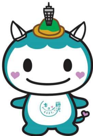
「キュンとするまち。藤沢」 公式マスコットキャラクター ふじキュン♡

イラストの使用にあたっては、原則として、「「キュンとするまち。藤沢」公式マスコットキャラクター ふじキュン♡」または「ふじキュン♡」の表記を付してください。