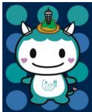
判別しにくい背景色