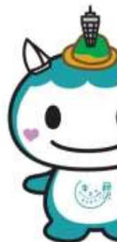
顔パーツの見切れ