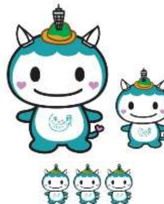
親子や友達のような使用や 大きさを問わず連続した使用