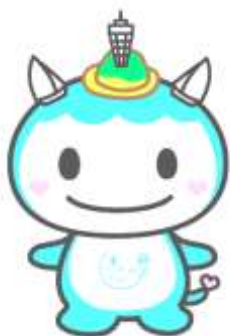
指定色以外の使用