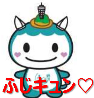
文字・イラスト等を重ねる