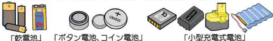
「乾電池」 「ボタン電池、コイン電池」

平成28年12月から「特定処理品目」の「乾電池」として出せる品目が増えました。この変更に伴い、「乾電池」から「電池類」に名称を変更しました。