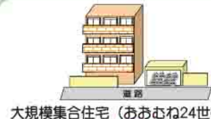
大規模集合住宅（おおむね24世帯以上）