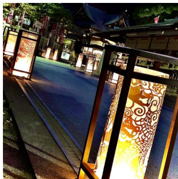
（参考）投稿写真イメージ