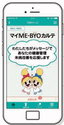
（参考）アプリ登録画面イメージ