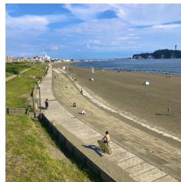
（参考）投稿写真イメージ