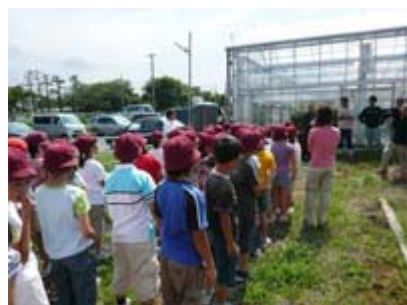
のうか 農家の かた 方の せつめい 説明を き 聞こうね