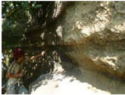
かせき 化石のようなものを み 見つけました