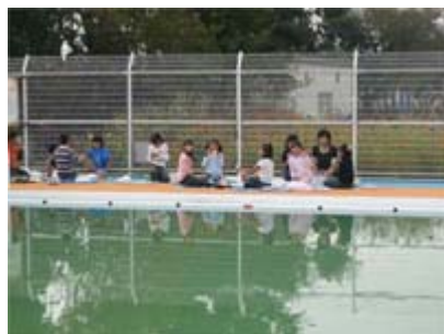
お プールに落ちないでね