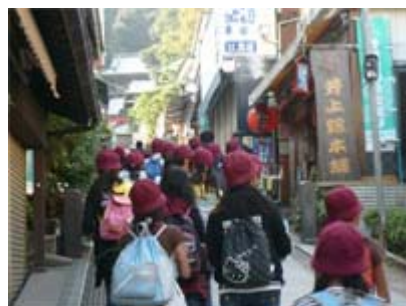
しよてんがい とお 商店街を 通って しま おく めざ 島の奥を 目指します