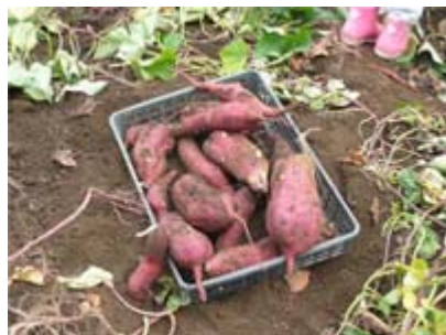
おお 大きいおイモだね