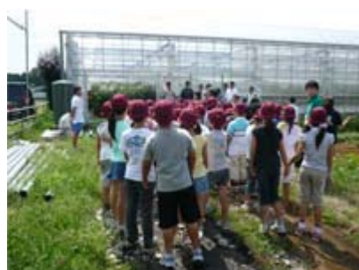
せいれつ 整列して、 はなし 話を き 聞きます