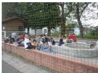
いけ まわ ジャブジャブ池の周りで おおも あ 大盛り上がり