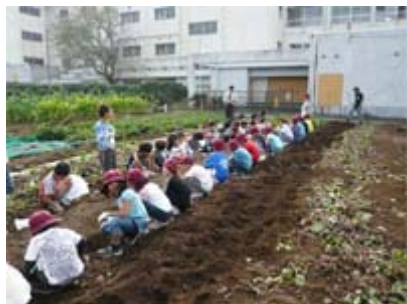
ほ じゅんび おイモを 掘る 準備ができました