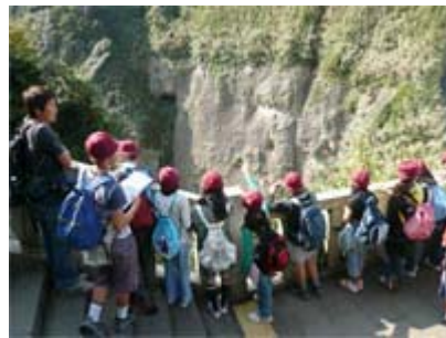
ちそう ようす 地層の様子がよく わ 分かるね