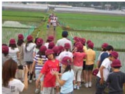
こめ ここで米づくりをしています