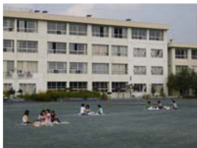
ひろい 校庭は、広いので ひと ちい かん 人が小さく感じます