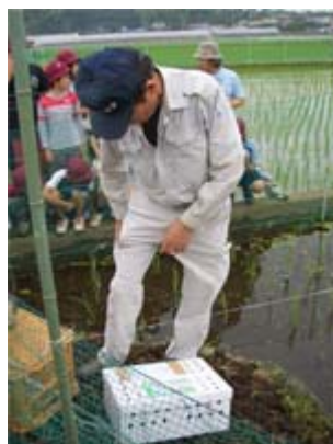
こめ しどうしゃ 米づくり指導者の