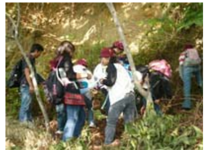
ちか よ 近くへ寄って くわ かんさつ 詳しく観察します