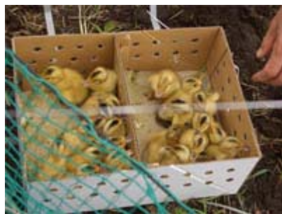
たまご 卵からかえった ばかりのひなです