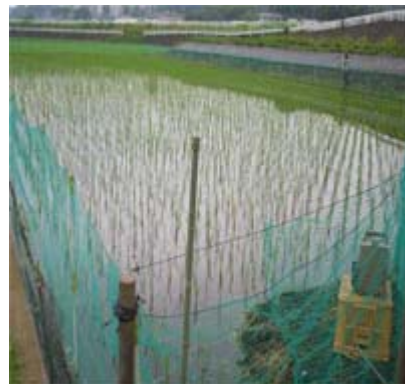
あいがも はな た 合鴨が放される田んぼです