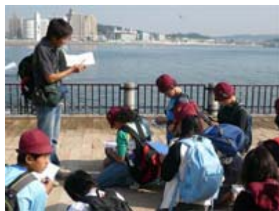
おおむかし え しま 大昔の江の島はね……