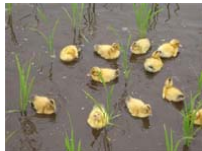
はじ みず はい 初めて水に入るので、 すいせい しょしんしゃ 水泳は初心者です