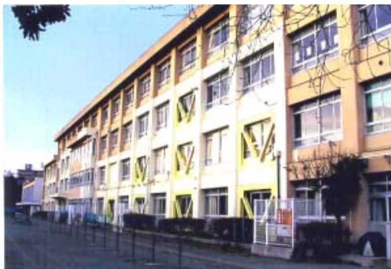
たいぎり しょうがっこう 大鋸 小学校

こんかい ことし がつ そうりつ しゅうねん むか たいぎり 今回は今年の4月に創立30周年を迎える大鋸 しょうがっこう しょうかい 小学校を紹介するね。