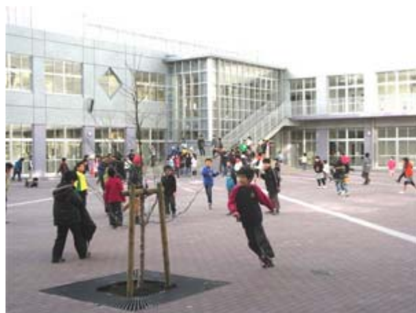
あたら あそ ぼ こうしゃ なかにわ 新しい 遊び場の 校舎 中庭

しんこうしゃ なかにわ やす じかん げんき あそ 新校舎には 中庭があるので、みんなで 休み 時間に 元気に 遊んでいます。