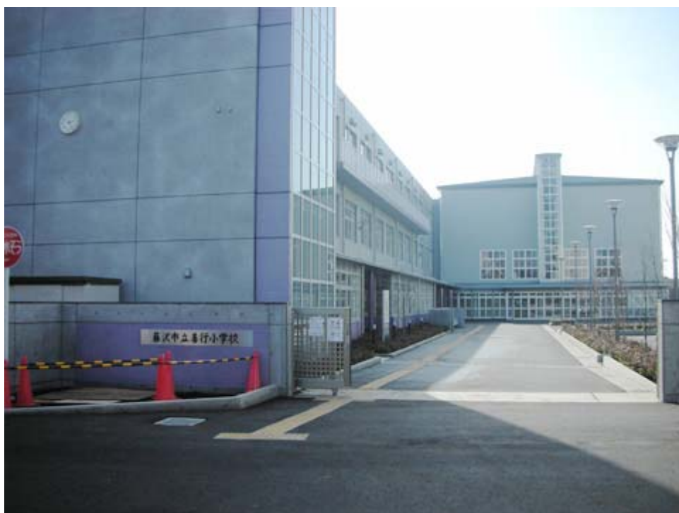
せんぎょうしょうがっこう 善行小学校