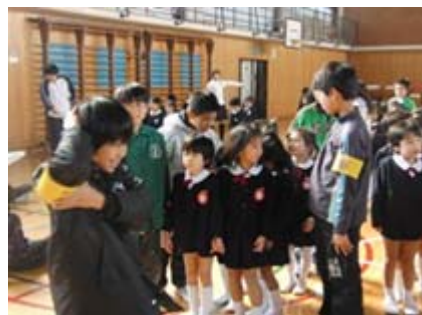
ねんせい 5年生による