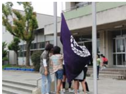
うんえいしん こうきけいよう 運営委員による 校旗掲揚