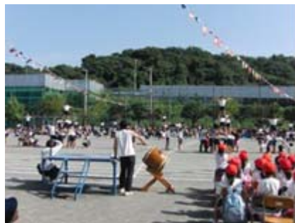
うんどうかい 運動会のレインボーブリッジ