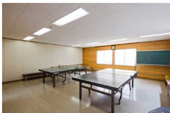
かぞく ゆうじん たの 家族や 友人と 楽しめる たつきゅうじょう 卓球場