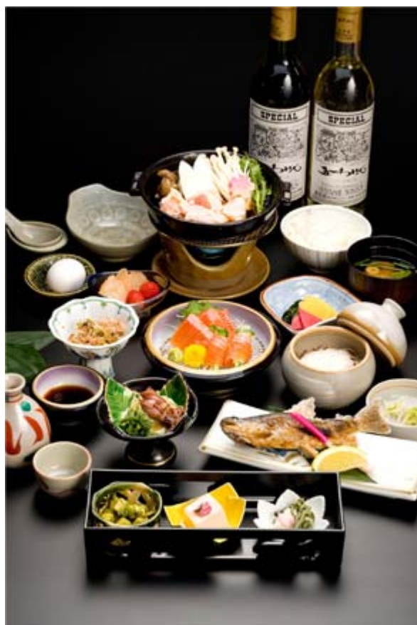
ゆうしょく 夕食(イメージ)