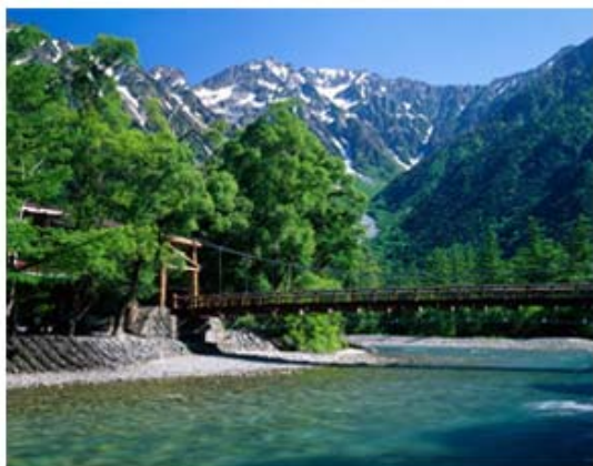
しんりく ほたかだけ かっぱばし かみこうち 新緑の穂高岳と河童橋(上高地)