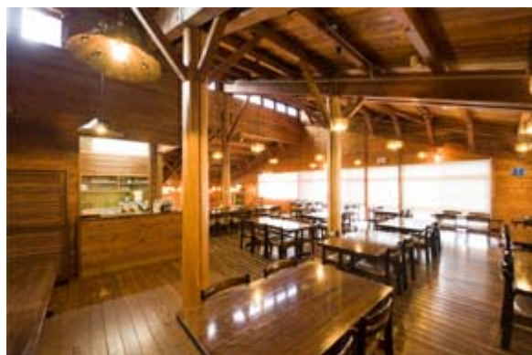
き 木のぬくもりを 感じる 食堂 かん しよどう