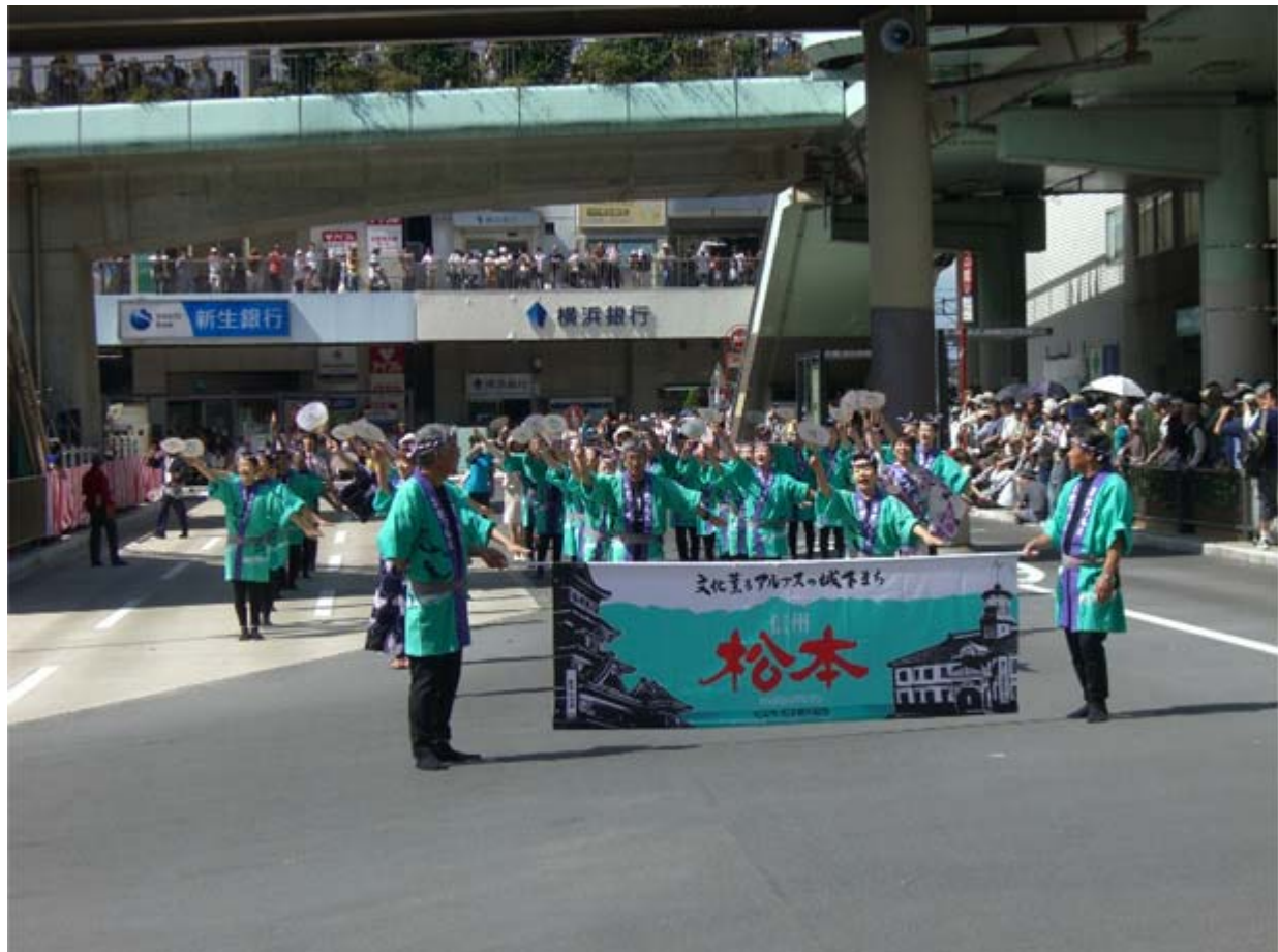
ふじさわしみん まつもと ひろろ まつもとし みな 藤沢市民まつりのパレードで「松本ほんほん」を披露する松本市の皆さん