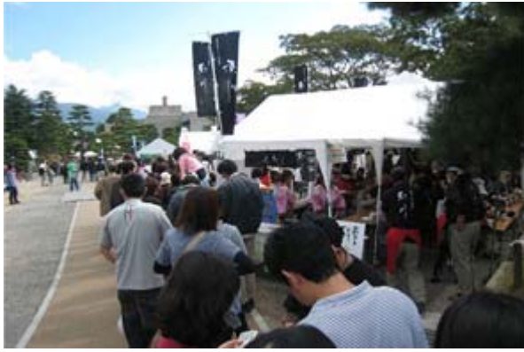
ぜんこく あつ 全国のそばが 集まります しんしゅう まつもと まつ ( 信州・松本そば祭り)