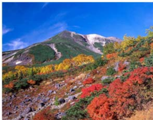
のけらだけ こうよう 乗鞍岳の紅葉