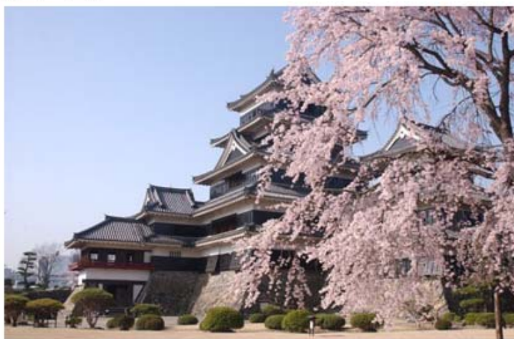
まつもとじよ さくら 松本城と桜