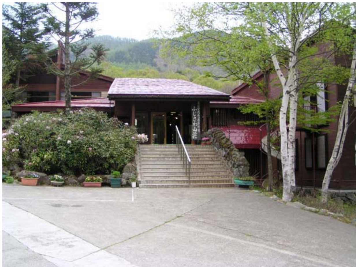
さんそう ふじさわ 山荘

まつもとし うつくしがはらこうげん さんそう しゅくはく まつもとし かんこう 松本市の 美ヶ原高原にある「ふじさわ 山荘」に 宿泊して 松本市の 観光をするのもよいかもしれません。 さんそう しきちない なつ うつくしがはらこうげん たの しきおりおり しゅこう 山荘の 敷地内では 夏にキャンプもでき、美ヶ原高原のトレッキングなども 楽しめます。四季折々の 趣向 こ りょこう きがる かんこう を 凝らしたバス 旅行もあるので 気軽に 観光することもできます。