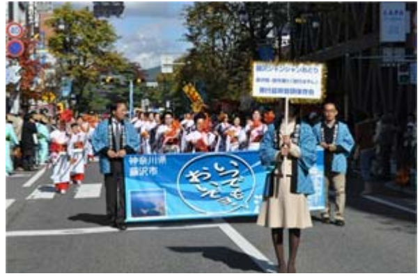
しみんさい まつもと ふじさわ まつもと 市民祭 松本まつりで「藤沢シヤン おど ひろう ふじさわし みな シヤン 踊り」を披露する 藤沢市の 皆さん