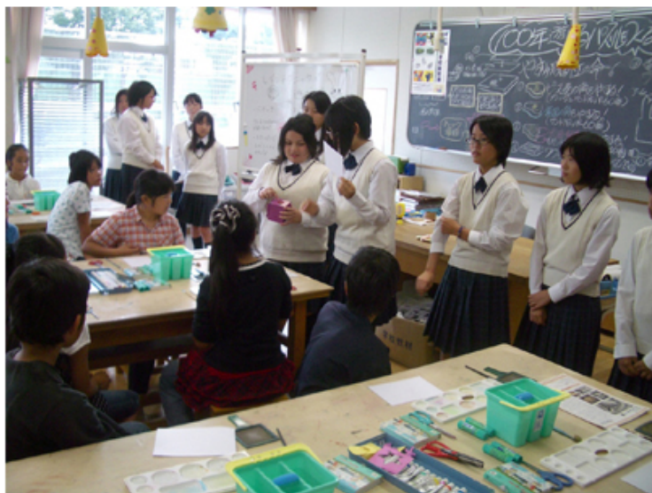
びじゅつぶ 美術部