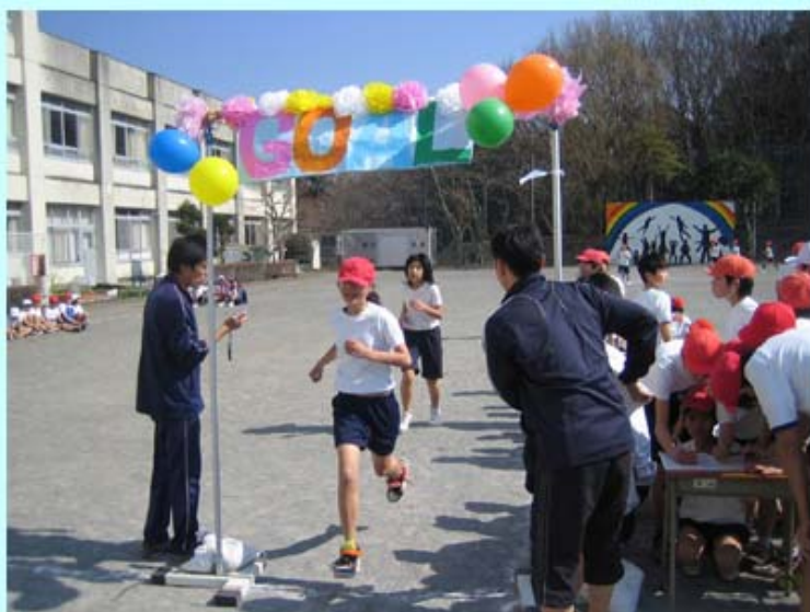
ゴール！！みんなよくがんばったね