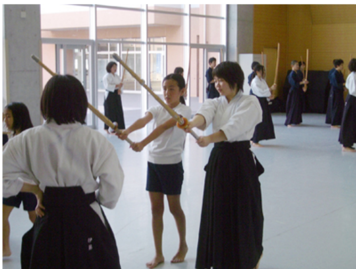
けんどうぶ 剣道部

ねんせい むつあいちゅうがっこう にい ねえ ちゅうがっこう やさ むか しい 5・6年生を 六会中学校のお 兄さん・お 姉さんが 中学校に 優しく 迎え入れてくれました。 ぶかつ にい ねえ かぶかつ れんしゅうふうけい ひろう けんどう た。14の 部活のお 兄さん、お 姉さんが 各部活の 練習風景を 披露してくれて、剣道やバレー ぶかつ れんしゅう たいけん ちゅうがっこうせいかつ ゆめ ボールなど 部活の 練習を 体験させてもらいました。中学校生活への 夢がふくらむひととき でした。