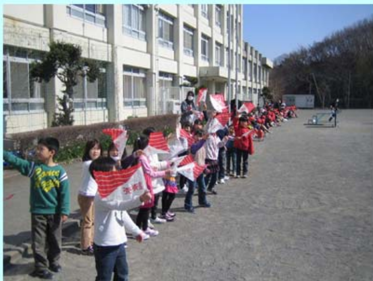
ていかねん こたち おうえん 低学年の子達が応援しているよ。がんばれー！！