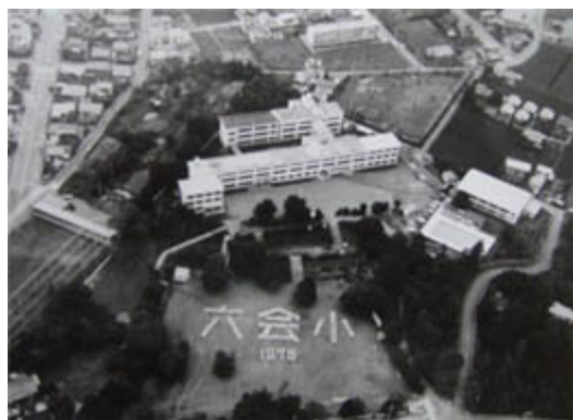
しょうわ ねんとうじ きゆうこうしゃ 昭和50年当時の旧校舎