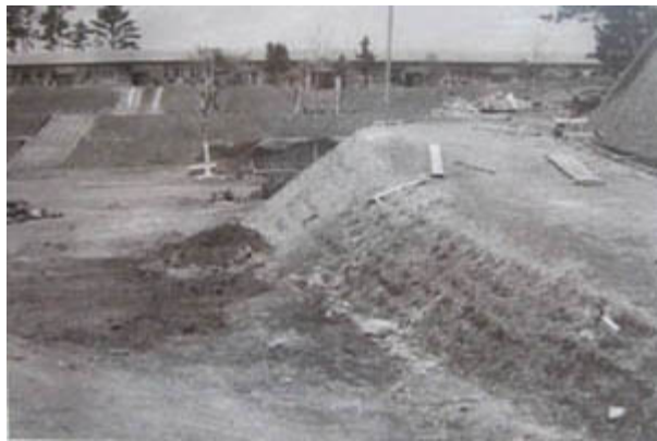
しょうわ ねんたい こうてい げんざい こうしゃ こうてい かいだんみきん 昭和20年代の校庭(現在の校舎～校庭の階段付近)