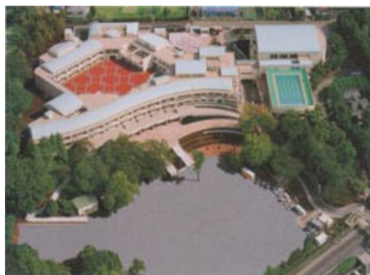
へいせい ねん た か げんざい こうしゃ 平成11年に建て替えた現在の校舎