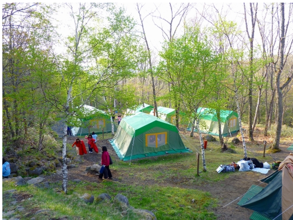
キャンプ場 じょう