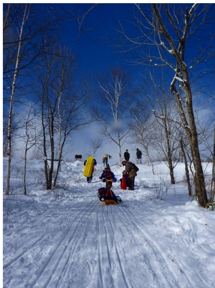
ふゆ いちめん ぎんせかい なか あそ 冬、一面の銀世界の中、そり遊び