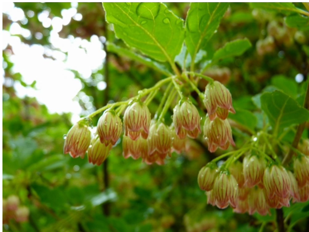
サラサドウダンツツジ