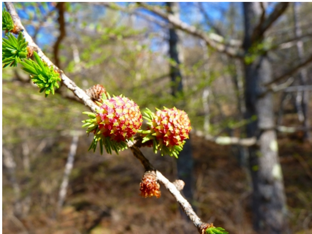
ねん と さ めばな 2 年に1 度 咲くカラマツの 雌花