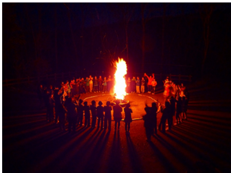
なつ 夏のキャンプでキャンプファイアを たの 楽しむ