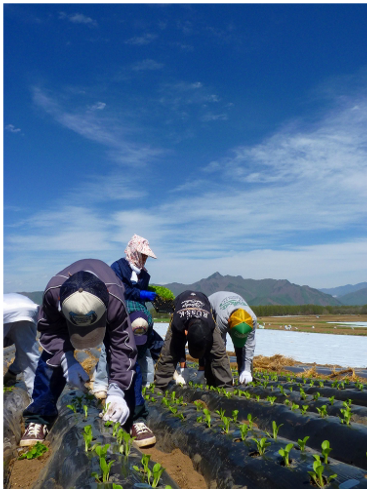
まちよう のうぎょうたいけん 貴重な農業体験