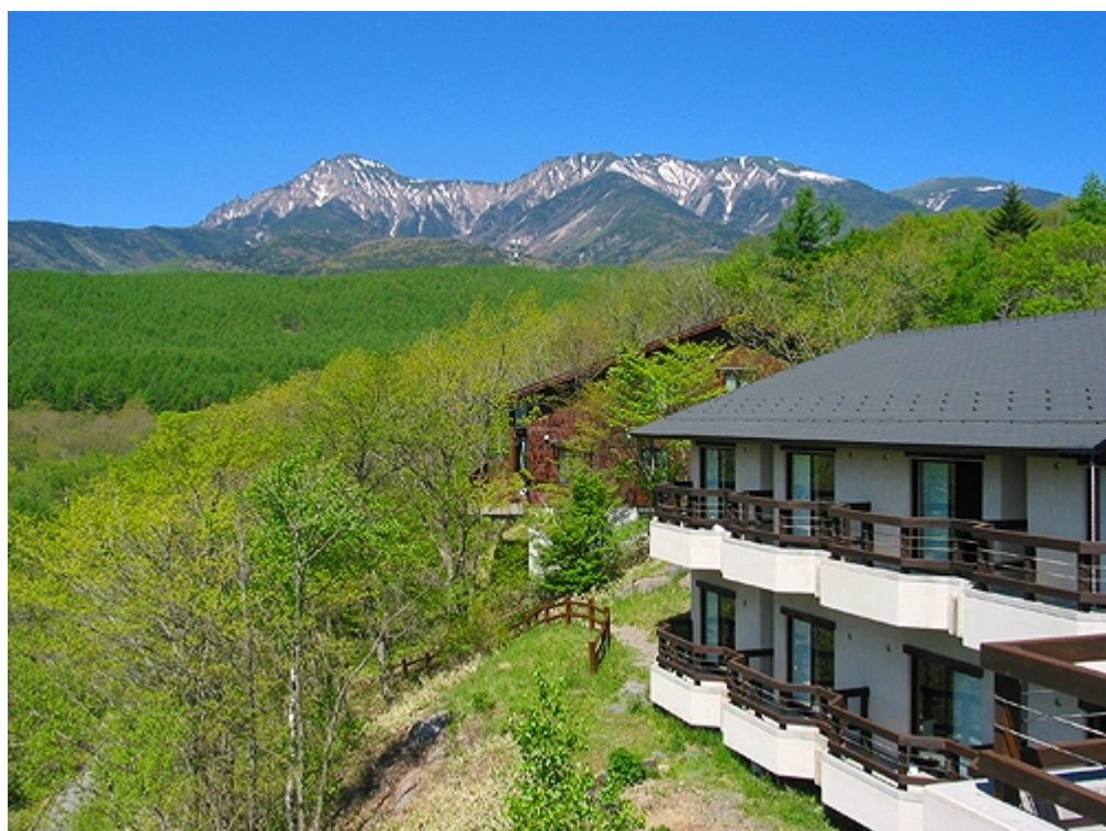
やつがたけやがいたいけんきょうしつ やつがたけ 八ヶ岳野外体験教室と八ヶ岳