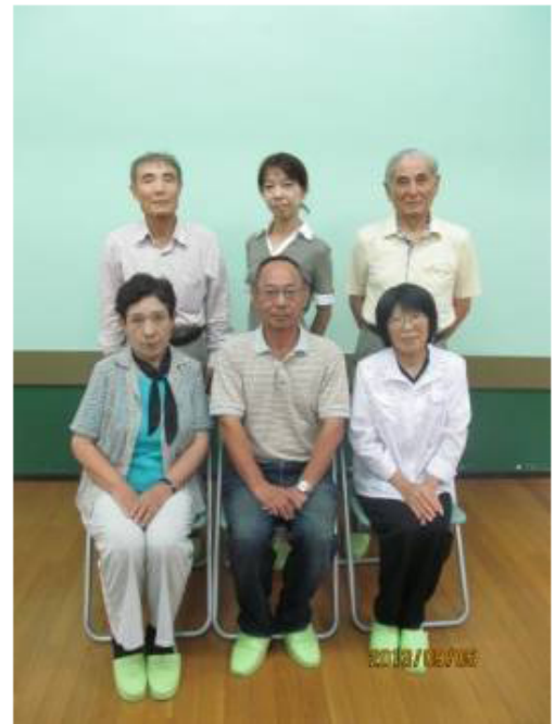
つじどうせいしよねんかいかん 辻堂青少年会館 うんえいしょくいん みな 運営委員の皆さん

かいかんしょくいん みな これからも会館職員の皆さんとともに こ いばしょ まも けんぜん 子どもたちの居場所を守り、健全でニ かいかん うんえい ズにあった会館を運営していきますの みな あそ き で、皆さん遊びに来てください！