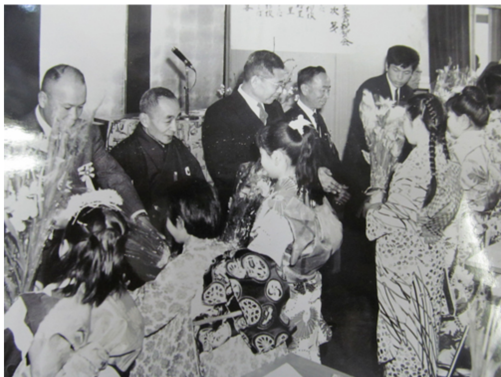
しゃんていきよ あいざわみのる