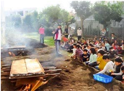
ねんせい や たいかい 1・2年生 焼きいも大会 ほごしゃ ちいき かた おうえん き 保護者・地域の方も応援に来てくれました

こうないけんきゅう そ かがくねん がくしゅう おこな 校内研究のテーマに沿って、各学年でさまざまな学習を行 っているよ。