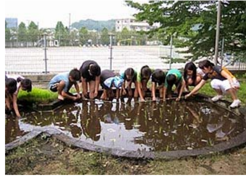
ねんせい たう 5年生 田植え やわら つち はだし はい なえ たお 柔らかい土に裸足で入り、苗が倒れないように う 植えました