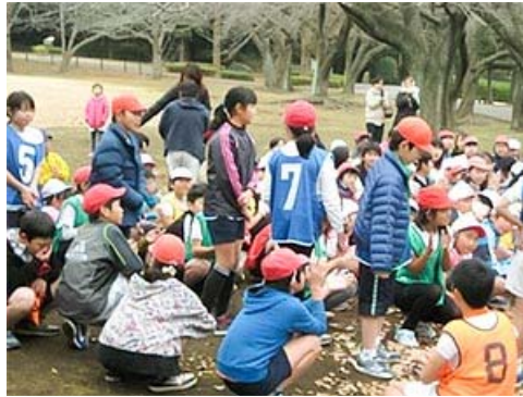
ねんえきでんたいかい 5・6年 駅伝大会 きずな じぶん う チームの絆は自分のがんばりから生まれます

がくねん ちから あ もくひょう む チームやクラス・学年で力を合わせ、目標に向かってがんばっているわね。