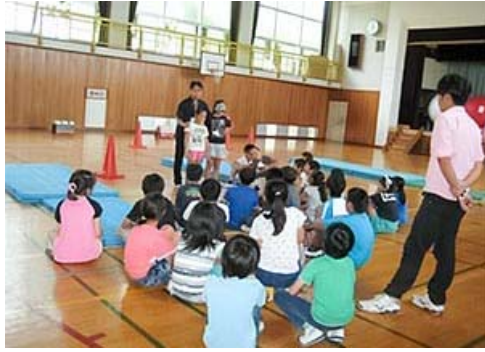
ねんせい 4年生 だれもがかかわりあえるように ふくしたいけん まな ちいき こうどう 福祉体験で学んだことを地域でもさっそく行動！