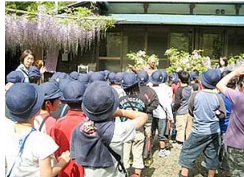
ねんせい がつく 3年生 学区たんけん はやま えん たんけん 端山ふじ園を探検しました