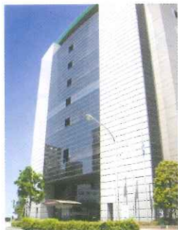
外観はこのような建物です