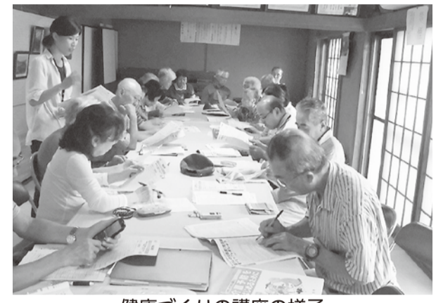
健康づくりの講座の様子

申し込み 講座開催予定日の20日前までに生涯学習総務課、各市民センター(石川分館を除く)・公民館にある申込書を書いて、代表者が同課へ郵送・ファクスするか、同課または各市民センター(石川分館を除く)・公民館へ持参で ※3カ月前に相談が必要な講座もあります ※申込書は市のホームページの「電子申請申請書ダウンロード」からダウンロードもできます