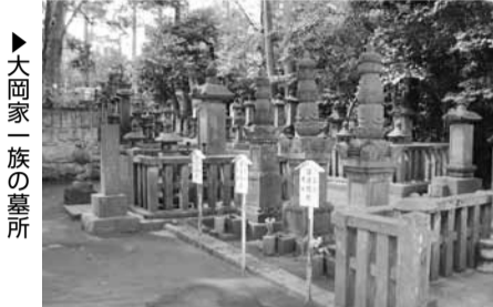
▶大岡家一族の墓所

浄見寺は大岡忠相の先祖、大岡忠政が家族の霊を供養するために建立した大岡一族の菩提寺です。寺のある茅ヶ崎市堤は、かつて徳川家康から忠政に与えられた領地でした。境内の寺林は、県の天然記念物に指定されており、中でも樹齢300年を越えるオハツキイチヨウ(一本指定)は葉の上に