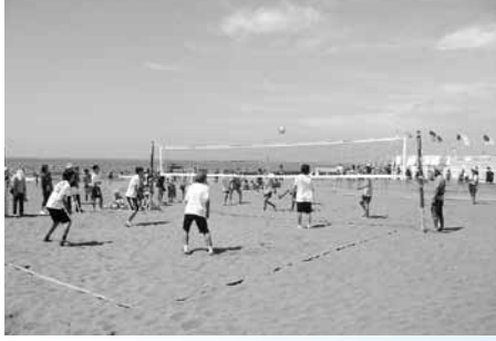
中学生ビーチバレー

大会実行委員会事務局 ☎(22)5633 または スポーツ推進課 ☎(50)8243