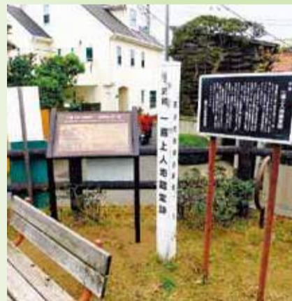
片瀬3丁目まちかど公園