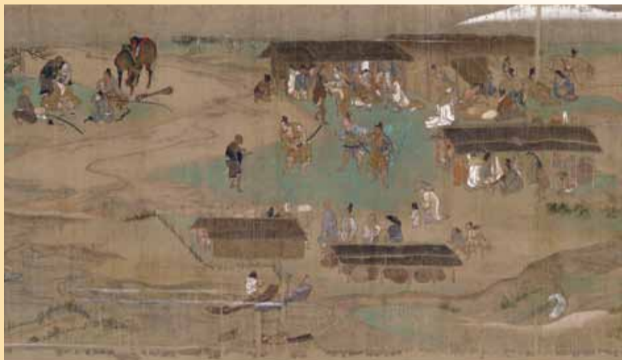
鎌倉に入ろうとする一遍(第5巻)〈清浄光寺(遊行寺)蔵〉