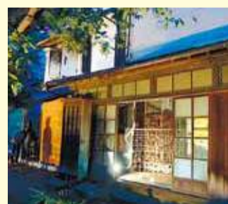
旧稲元屋ライトアップ2014

期間 10月3日~25日毎週土・日曜日、祝日午前11時~午後7時(10日~12日は午後8時まで) ※詳細はお問い合わせください