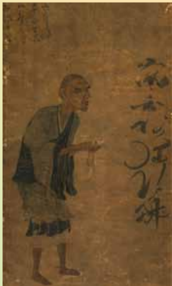
県指定 紙本墨画淡彩 一遍上人像 (清浄光寺(遊行寺)蔵)

美術品としての価値に加え、一遍の没後から10年以内に制作されていることから、鎌倉時代の人々の生活や景観を伝える歴史資料としても高く評価されています。