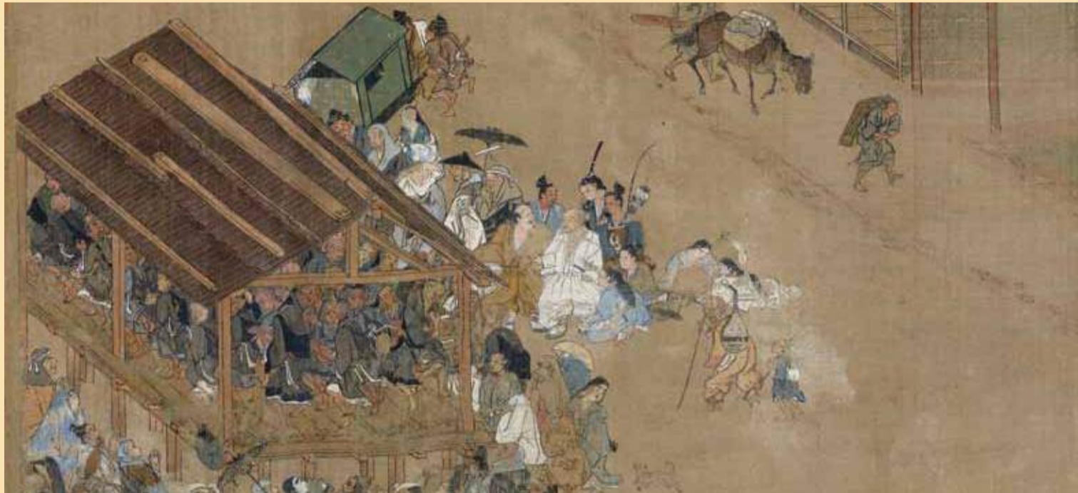
片瀬浜の踊り念仏(第6巻)〈清浄光寺(遊行寺)蔵〉

会期 11月3日(祝)～12月13日(日) 別本の第7巻と関連作品を展示 問い合わせ ハローダイヤル☎03(5777)8600