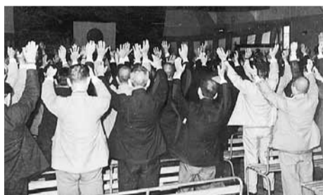
合併祝賀式典の様子(1955年、湘南高校)