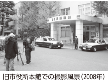
旧市役所本館での撮影風景(2008年)

フィルムコミッションは、映画やドラマなどが円滑に撮影できるよう、ロケ地の紹介や公共施設などの許認可手続きなどをサポートする総合窓口です。 主に自治体や関係団体が運営を担っており、本市では2002年9月に観光課内に湘南藤沢フィルム・コミッションが設立されました。 映画やドラマなどの撮影に協力することで本市の映像を全国に発信し、地域経済や観光の振興につなげることを目的に活動しています。