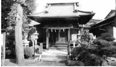
御霊神社(写真右) 旧相模川橋脚(写真左)

旧相模川橋脚と義経伝説 国道1号下り線下町屋橋手前を南に入ると、国指定史跡の旧相模川橋脚があります。 この辺りは長い間水田でしたが、1923年の関東大震災とその翌年の地震によって、突然橋脚が水田の中から姿を現しました。これは1908年に、源頼朝の重臣稲毛三郎重成が亡き妻の供養のために相模川に架けた橋とい