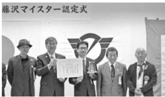
藤沢マイスター認定式

「藤沢マイスター」とは、極めて優れた技能・技術を駆使し、本市の市民生活や産業の発展を支える技能者・技術者に市が贈る最高峰の匠としての称号です。市内で活躍している皆さんの応募をお待ちしています。 応募資格 市内在住もしくは市内を拠点にもつくりに関わる 仕事に従事している技能者・技術者 ※自薦・他薦は問いません 応募方法 6月3日(金)〈必着〉までに産業労働課、各市民センター・公民館・市民図書館などにある推薦書に必要事項を書いて、産業労働課労政担当へ郵送または持参で ※認定要件や選考方法など詳細は、推薦書をご覧ください