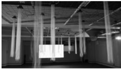
山田哲平《そのなかにも在るかもしれない》2015 ※参考図版