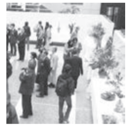
▲30周年時の華道展の様子