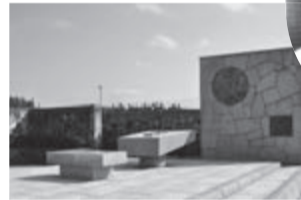
▼ 鶴沼海岸の聶耳記念碑

中国国歌「義勇軍行進曲」の作曲者で、中国現代音楽の先駆者といわれている「聶耳」が1935年来日し、鶴沼海岸で遊泳中に溺れ死しました。異国の地で生涯を終えた青年の死を悼んだ市民により、54年11月に聶耳を偲ぶ記念碑が建てられました。これをきっかけに81年8月、昆明市長から友好都市提携をしたい旨の文書が寄せられ、同年11月5日、友好都市締結の調印式が行われました。