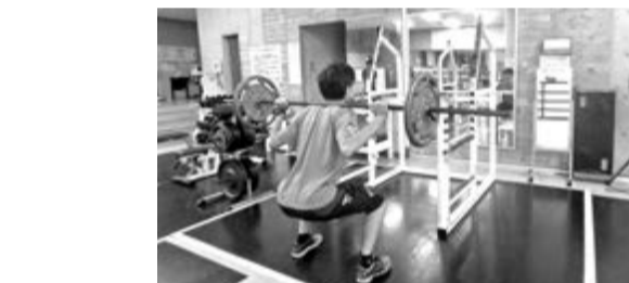
秋葉台文化体育館