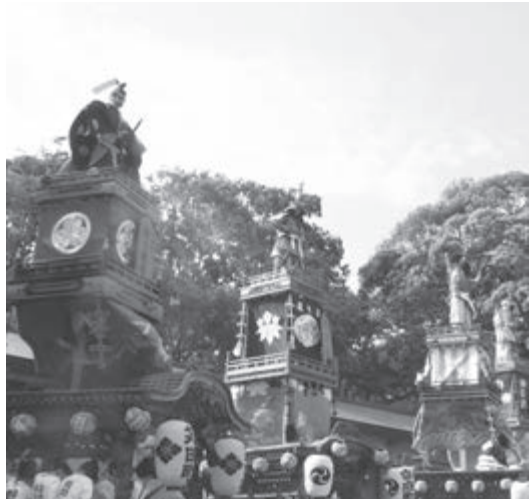
▲三層式の人形山車