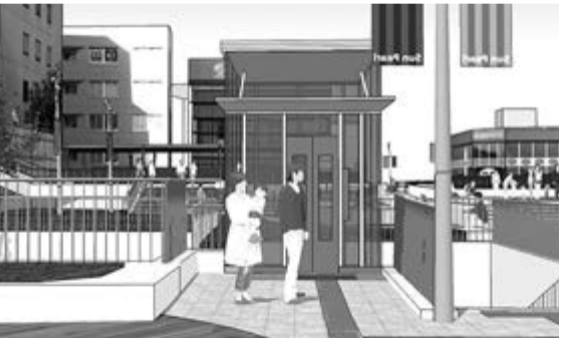
エレベーターの新設で、バスターミナルと藤沢駅の行き来がスムーズになります。

既存のエレベーターやスロープの改良を行うとともに、新たにエレベーター2基とエスカレーター1基、スロープ1カ所の設置を進めます。エレベーターは車いすが2台同時に乗車でき、救急搬送で使用するストレッチャーの乗車も可能です。