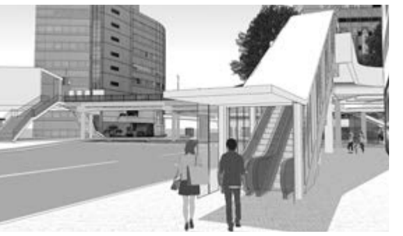
ビックカメラ南側の階段は、エスカレーターに造り替えます。