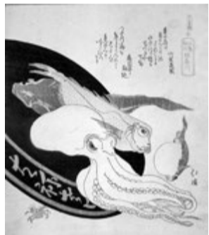
魚屋北溪「江島記行 神奈川」

申し込み ②は2月1日(水)、①は8日(水)ともに午前10時から電話またはファクスに住所・氏名・電話番号を書いて、藤澤浮世絵館 ☎(33)0111、FAX(30)1817へ