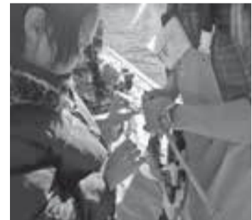
農業水産課 ☎251ノ8601 朝日町1ノ1へ ※抽選結果は11月末までに応募者全員に郵送でお知らせします

親子でワカメの種付けから刈り取りまでを行います。江の島周辺の環境を学習し、地産の食への理解を深めましょう。 とき 12月8日(土)、2019年2月16日(土)午前10時～正午、全2回 ところ 片瀬漁港 対象・定員 全回参加で