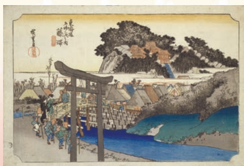
▲ 初代広重「東海道五拾三次之内」藤沢

東海道五十三次コーナーでは、初代の「狂歌入東海道」シリーズ、藤沢宿コーナーでは二代の「江戸名所四十八景」シリーズを紹介します。