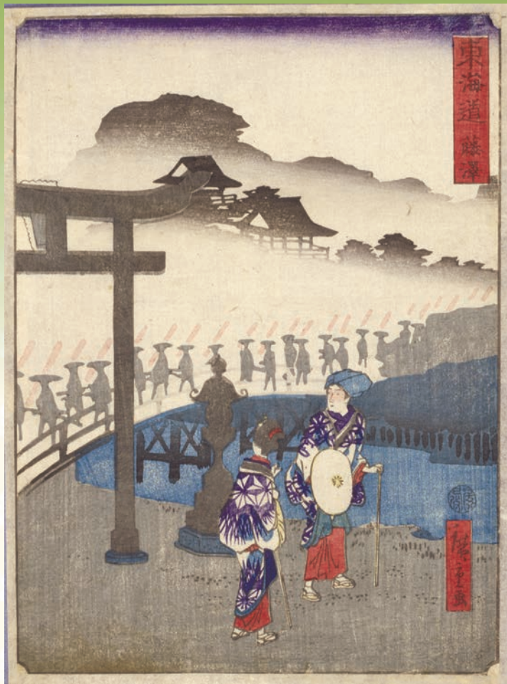
▲ 二代広重「東海道 藤沢」

浮世絵の風景画を確立したと言われている初代歌川広重と、その弟子・二代広重(重宣)と三代広重(重政)。3人に共通する風景描写の特徴と、それぞれの個性に着目した展示を行います。