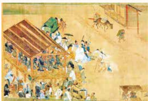
片瀬での踊り念仏(一遍聖絵)