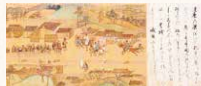
鎌倉入りを拒否される一遍(一遍聖絵)