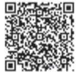
▲ペットの防災について