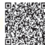
▲マイ・タイムラインの作り方