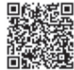
▲ペット同行避難や車両による避難先について