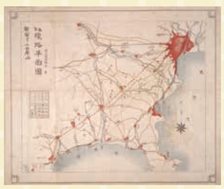
▲「計画線路平面図 新宿ヨリ小田原間」