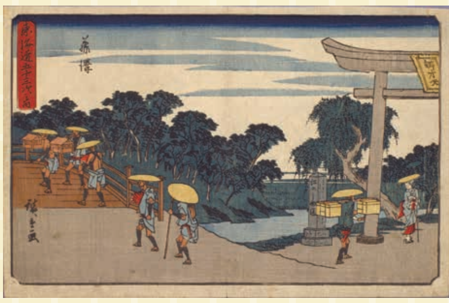
◀歌川広重「東海道五十三次之内 藤沢」

発行日 毎月10日・25日 編集 藤沢市広報課 〒251-8601 朝日町1-1 ☎0466(25)1111 FAX0466(24)5928 (休日・夜間は☎0466(25)1114)