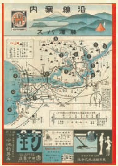
▲藤沢バス「沿線案内」