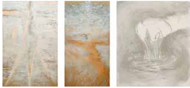
井上拓哉《母に囲まれて遊ぶ子どもたち》2021