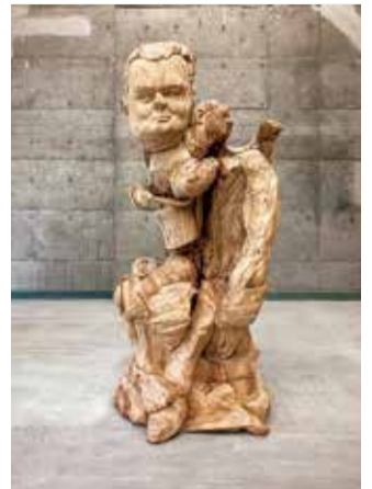
栗田大地《個の諸要素》2021