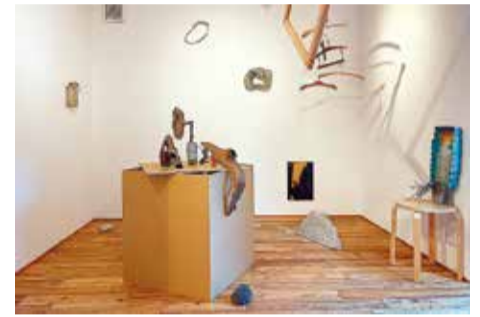
宙宙《しぜんのかたち》2021