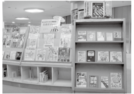
交通安全に関する資料展示などを行います。

12月は、交通量や飲酒の機会が増加などにより交通事故が多発する時期です。交通ルール・マナーを守りましょう。 ☆飲酒を伴う会合には、自動車を運転したり、自転車に乗って行ったりするのをやめましょう ☆運転者は横断歩道での歩行者優先を徹底しましょう ☆二輪車はカーブや下り坂などではスピードを抑え急ハンドルや急ブレーキをかけないようにしましょう 図書館で関連資料を展示します 年末の交通事故防止運動に合わせて、各市民図書館