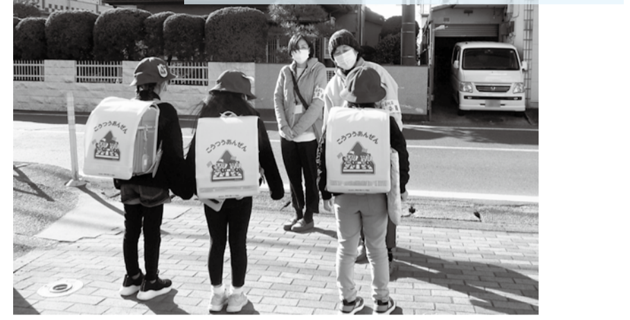
通学路での見守り活動(六会地区)

コロナ禍で人と人とのつながりが保ちづらい状況の中、支援が必要な方たちを見逃さないように、感染対策を徹底した上で活動しています。