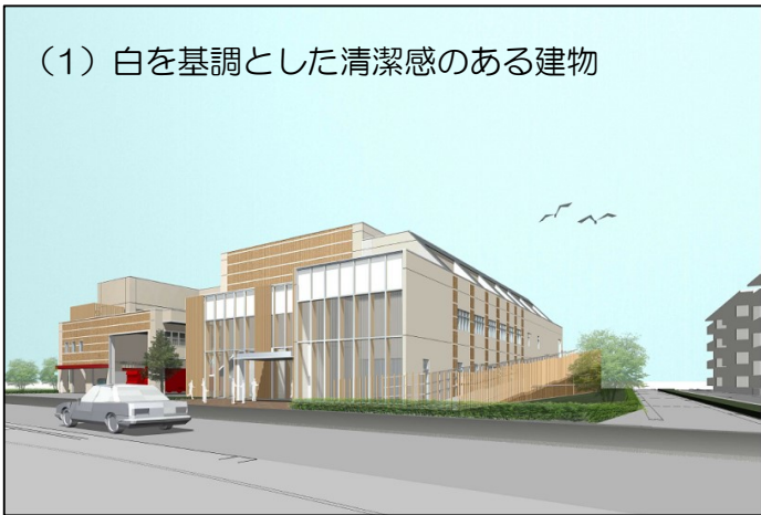
(1) 白を基調とした清潔感のある建物