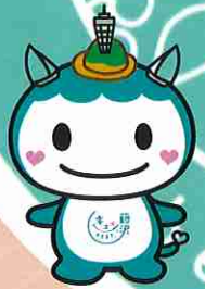
「キュンとするまち。藤沢」 公式マスコットキャラクター ふじキュン♡