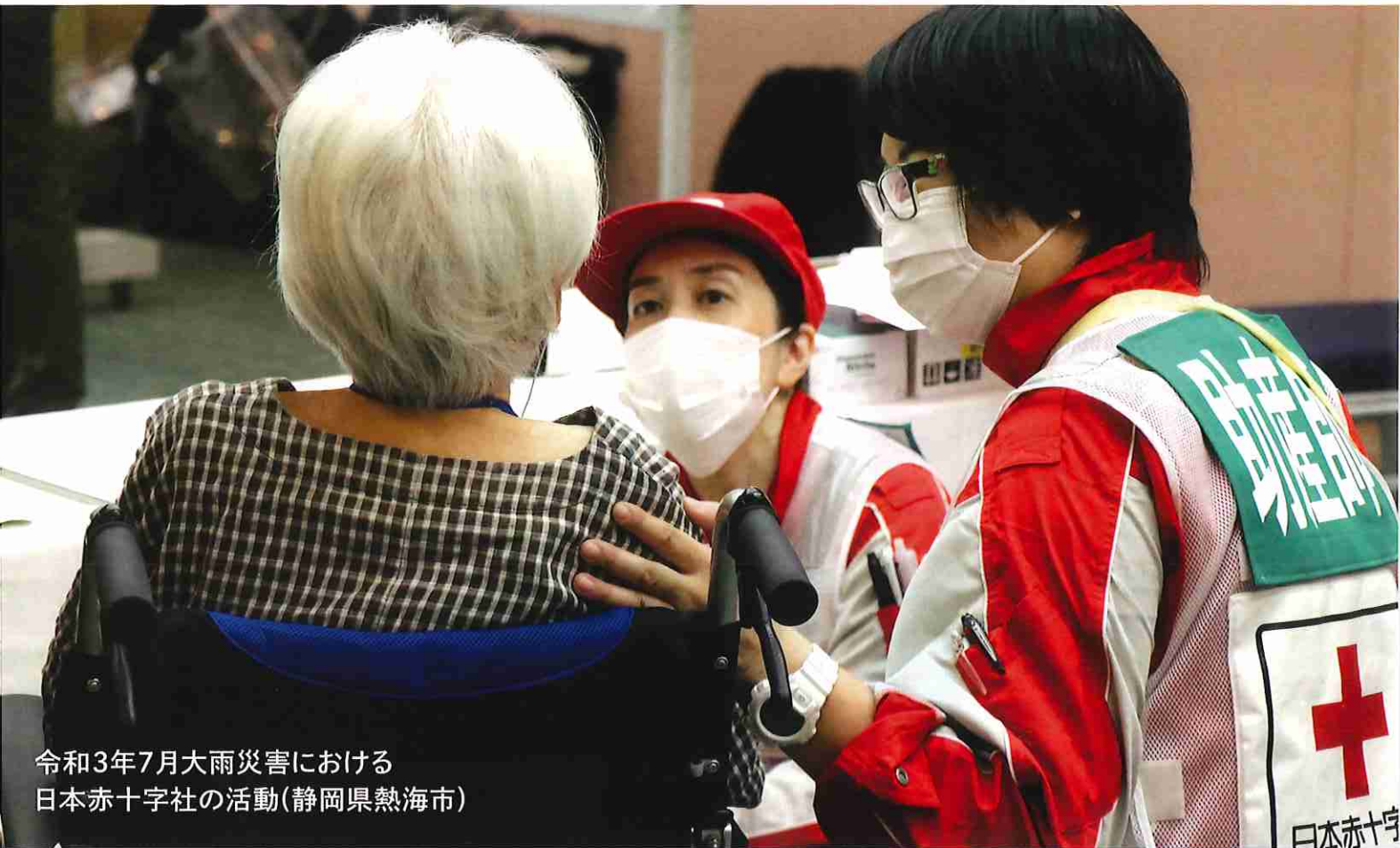
令和3年7月大雨災害における 日本赤十字社の活動(静岡県熱海市)