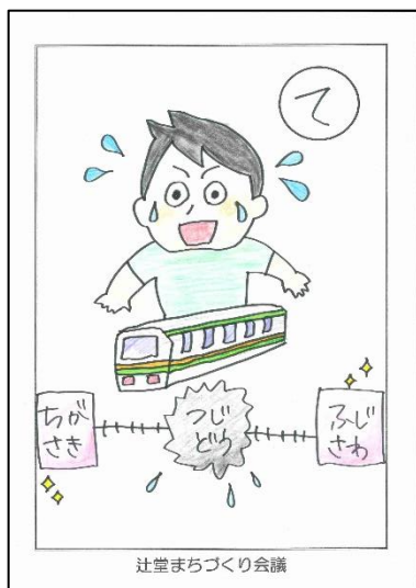
「停車しない 快速アクティ― 茅ヶ崎へ」