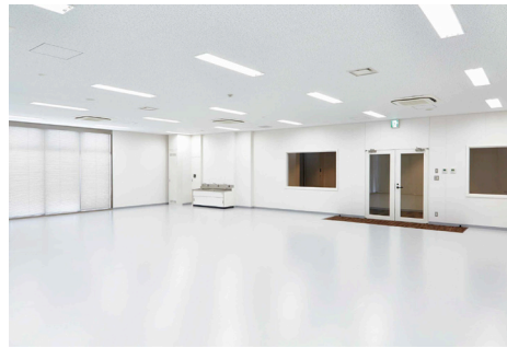
レジデンスルーム（約 138 m 2 ）

藤沢市を中心とした湘南地域ゆかりの若手アーティストの創作活動および展示活動を支援するため、藤沢市が2015年10月に開設した美術振興施設です。本プログラム「AiF」では、全国のアーティストから応募を受け付けます。