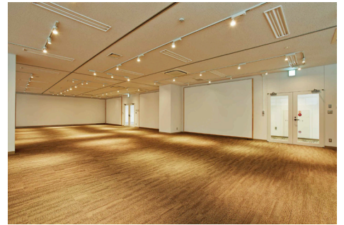
展示ルーム（約 200 m 2 ）