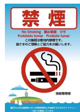
「敷地内禁煙」の標識

公共的施設の禁煙環境の表示については、積極的に行い、子どもをはじめとした非喫煙者がタバコの煙を吸わされない環境を整えることを推進します。