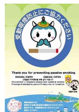
「受動喫煙への配慮」の標識

加えて、喫煙場所においては、喫煙をすることができる場所であること、当該場所への20歳未満の者の立入りをしないこと等を記載した標識の掲示をすることが望まれます。（参考：健康増進法（平成14年法律第103号、平成30年7月25日改正公布、令和2年4月1日施行）第27条、平成31年1月22日付・健発0122第1号厚生労働省健康局長通知、平成31年2月22日付・健発0222第1号厚生労働省健康局長通知）