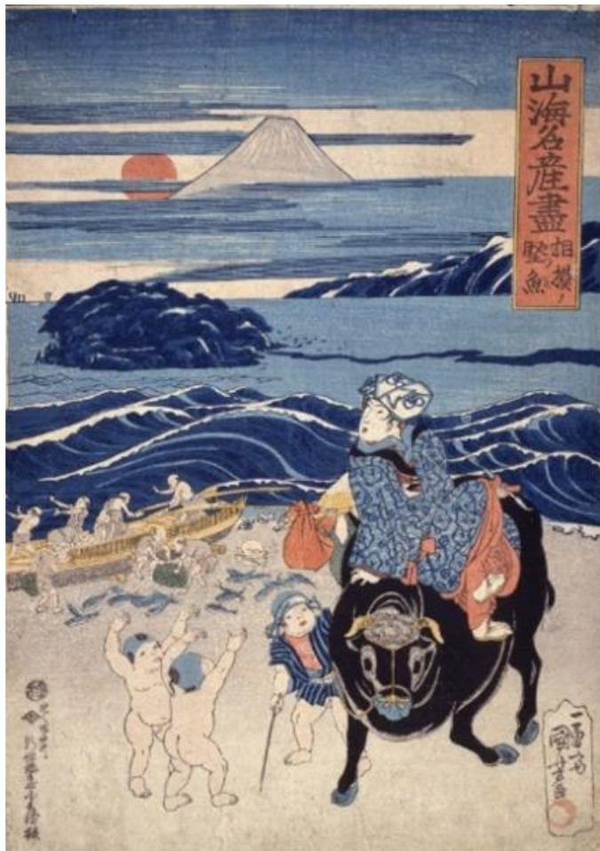
「山海名産尽 相模ノ堅魚」

この絵のシリーズは各地の名産品を国（地域）ごとに描いたもので、相模（現在の神奈川県の大分）の名産品としてカツオが選ばれています。俳人松尾芭蕉（まつおばしろう）の句に「鎌倉を生きて出（いで）けむ初鰹（はつがつつお）」とあるように、