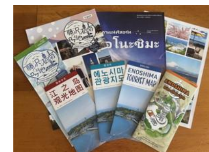
多言語で作成された観光パンフレット

さらに観光協会では江の島・片瀬地区の魅力を広く伝えるためにかかせないアニメや映画、テレビ等の撮影の際には、現地と製作者との間で調整役も務めるとのことです。