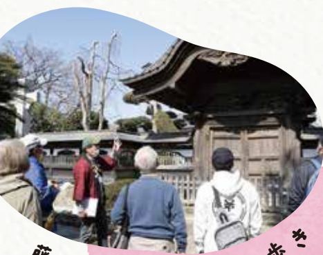
藤沢宿をめぐるまち歩き