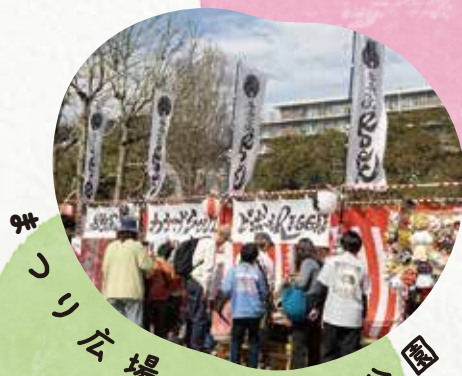
公園 御殿辺 おしなま場