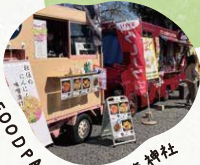
FOOD PARK in 白旗神社