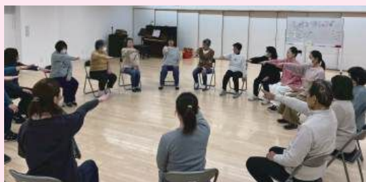
上半身ストレッチ (シニアリトミック)

1月26日(月)F プレイスの多目的室にて、役員研修「レッツリトミック」が行われました。キッズリトミックとシニアリトミックの二つで構成され、音楽に合わせて身体を動かしたり、スカーフ・スティック・テニスボールといった教具を使用しながらリトミックを体験しました。即時反応力、リズム感、表現力、短期記憶力、集中力、コミュニケーションなど数々のリトミックの要素がありました。