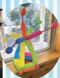
「ぼうし」を作りました