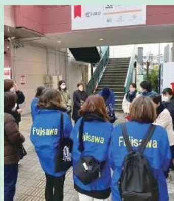
パトロール前の打ち合わせ

地域の青少年指導員が中心となって通学路や公園をまわり、子どもたちに声かけをしたり、危険なところがないか確認しています。学校の先生、校外委員が参加することもあります。