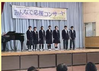
第一中学校合唱部