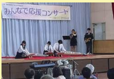
県立藤沢清流高校箏曲部&吹奏楽部