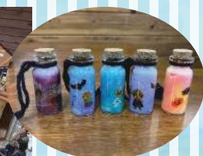
ハロウィンまつりで作った「魔法の小瓶」