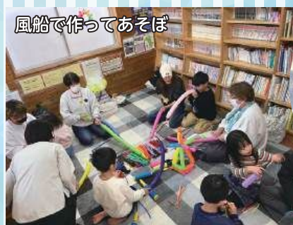
風船で作ってあそぼ