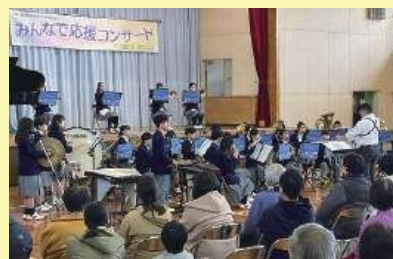
大清水中学校吹奏楽部