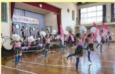
湘南ドルフィンズ・マーチングバンド

「みんなで応援コンサート」は藤沢西部地区で活動している青少年に発表の場を提供し、その活動を応援するために開催されています。今年度は大清水中学校体育館をお借りし開催いたしました。久々に県立藤沢清流高校の参加もあり、多くの来場者とともにスタッフ一同も楽しいひと時を過ごしました。