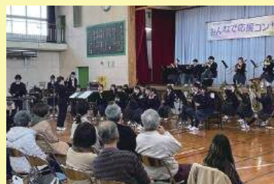
第一中学校吹奏楽部