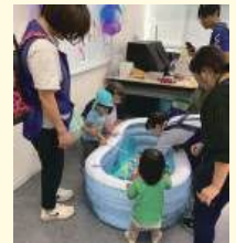
藤沢市民センターまつり