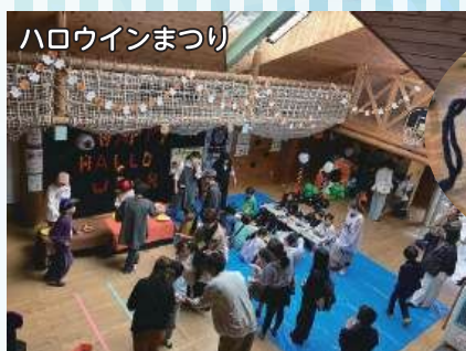
ハロウィンまつり

家でも楽しめるように作った工作キットも不定期で配布しました。子ども関係の行事や企画・運営に興味のある方も募集しています。