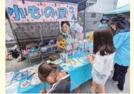
じゃりんこまつり