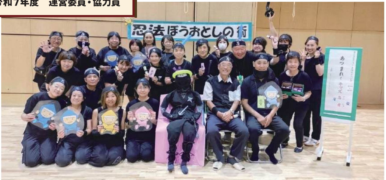
7月「集まれ！キッズ忍者」にて（藤沢市民センターと共催）