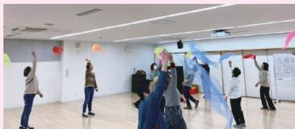
ピアノの合図に合わせて (キッズリトミック)