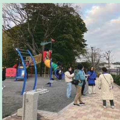
公園の点検（危ないところはないかな）