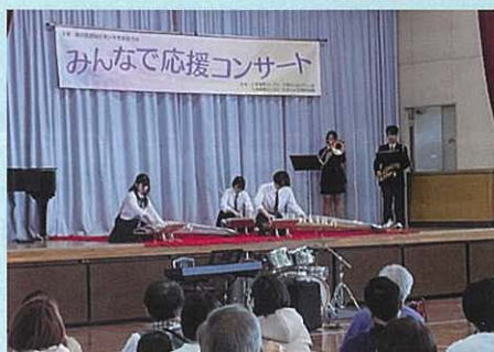
県立藤沢清流高校箏曲部&吹奏楽部（和洋箏吹）

藤沢西部地区青少年育成協力会の主催、三者連携ふじさわ「大清水心のかけはし会」「たまじやり応援団会議」の共催で、藤沢地区で活動している青少年に発表の場を提供し応援するために開催しています。当地区からは県立藤沢清流高校と大清水中学校が出演しすばらしい演奏を披露していただきました。