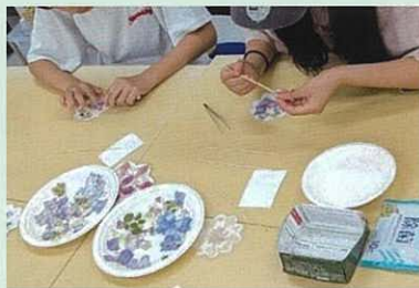
アジサイコースター作り