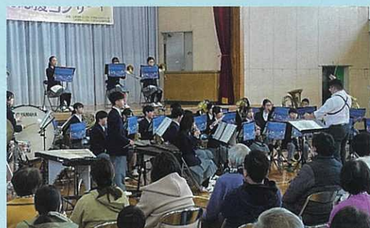
大清水中学校吹奏楽部