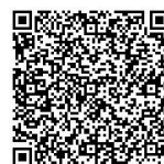
オンライン視聴用