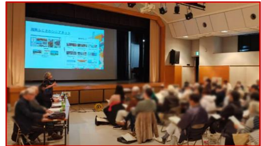
市民センターでの説明会