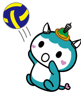
ワンバウンドバレー