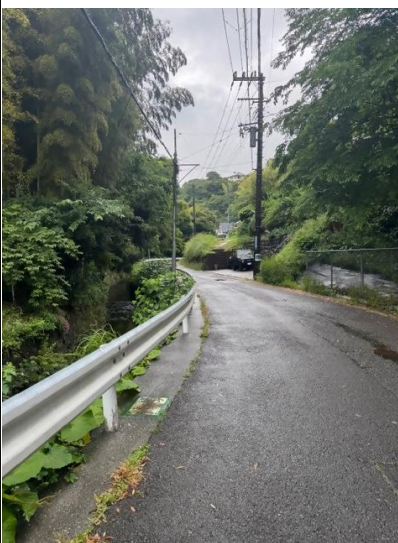
稲荷川(常蓮寺川)から片瀬山を望む

「百合合の坂をのぼったところに知り合いの畑があったので、リヤカーにたい肥を載せて運ぶ手伝いをしたことがあります。片瀬山駅ができるずっと前、腰越と片瀬の小学生在ああたりでよくケンカしたの。おたがいにはやしたてるような唄を唄ってたね」(片瀬在住80代男性)